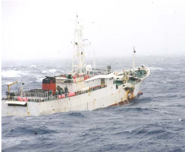
El Strela , de bandera rusa, identificado en 2002 como parte del grupo Pacific Andes Alphabet Boats, fotografiado en plena pesca IUU en la División 58.5.2 CCRVMA, en junio de 2003.

Si bien el nivel general de pesca de merluza negra IUU pudo haber disminuido a finales de los 90, después de alcanzar un máximo en 1996/97 (de aproximadamente 40.000 toneladas por año [tpa] según estimación de pesca IUU o aproximadamente 60.000 tpa según información comercial), el creciente esfuerzo realizado por los gobiernos, operadores con licencia y la comunidad en general para eliminar la pesca IUU en los Mares del Sur, no ha podido impedir el aumento de los niveles de pesca IUU en estos últimos tres años.