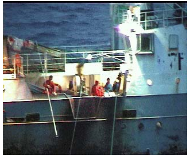
El Alos, encontrado claramente pescando en forma ilegal por la embarcación autorizada Southern Champion de Austral Fisheries en la zona de exclusión económica australiana de la Isla Heard (setiembre 2003)

Es inquietante observar la presencia de embarcaciones de bandera coreana. Evidencia adicional de que utilizan un buque transporte y de las estadísticas de la FAO de descargas en Corea y las subsiguientes exportaciones de merluza negra y sus subproductos, indican que la participación de intereses coreanos pueda convertirse en una parte sistemática de las actividades de pesca IUU en los Mares del Sur. A menos que los funcionarios del gobierno coreano se muevan rápidamente para detener el curso de estas actividades, podrían llegar a considerarse cómplices de la pesca de merluza negra IUU.